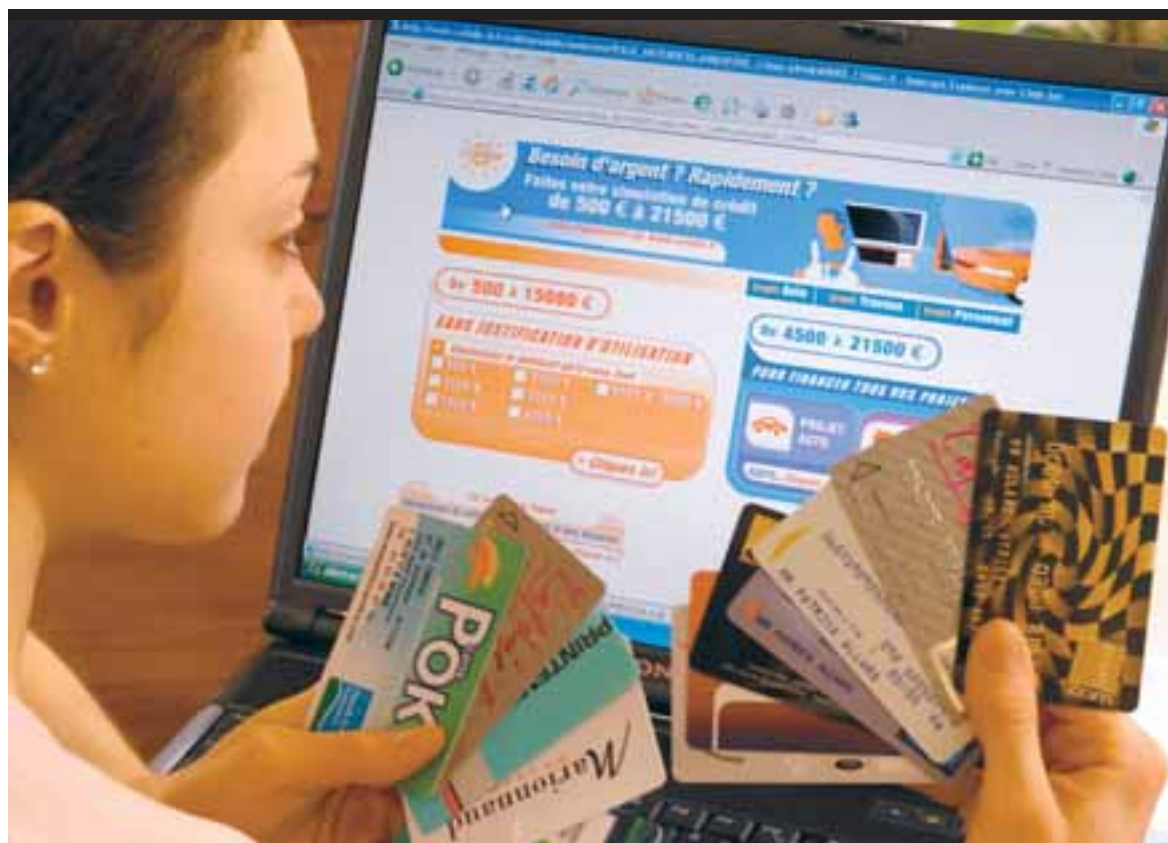
L'accès aux offres de revolving passe aujourd'hui fréquemment par les sites Internet des distributeurs spécialisés. Il est le plus souvent lié à des cartes privatives ou bancaires.

Et encore ce schéma est-il simplifié, car les intérêts sont calculés par jour, sans méthode vraiment uniformisée. Pour faire bonne mesure, le loyer du crédit renouvelable dépend du montant accordé. Pour les petits prêts, les plus chers à cause des frais de dossier, le seuil de l'usure a franchi la barre des 20 %... Les révisions à la hausse inquiètent moins que pour l'immobilier : la charge mensuelle est bien plus modeste en revolving. La petite mensualité, 3 % à 4 % du